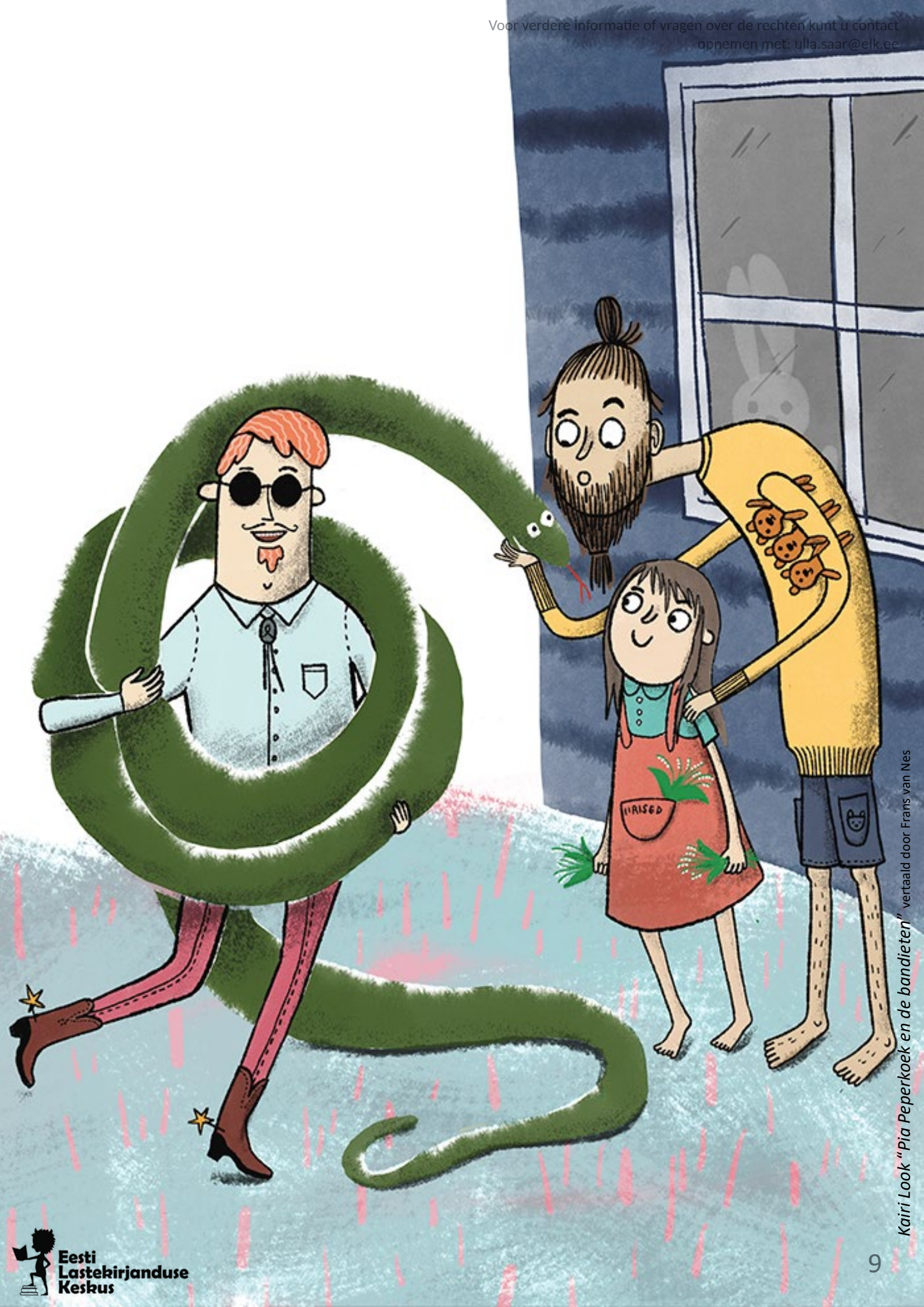
Kairi Look "Pia Peperkoek en de bandieten" vertaald door Frans van Nes